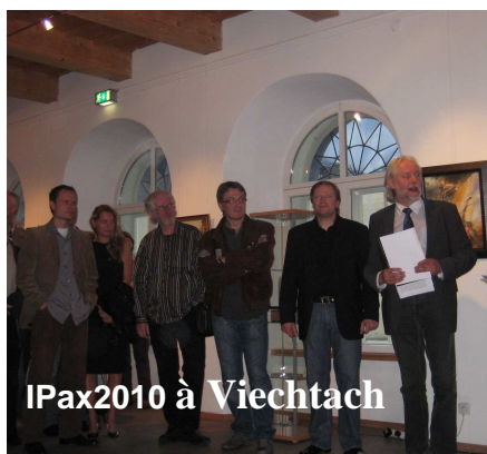
IPax2010 à Viechtach

Pour le mouvement rénovateur des « Héritiers de Dali », 2010 a été une année faste, riche en événements jubilatoires. Pour débiter, le salon de l'Art fantastique européen du Mont-Dore, 5 e du nom, s'était transformé en chaleureuse rencontre franco-espagnole du fait de la participation des peintres du prestigieux Reial Cercle Artistic de Barcelone. Le SAFE 2010 était devenu l'opération «Open Dore», qui proposait simultanément le salon de prestige dans les Thermes ainsi que l'exposition catalane «El Cim de l'Art» déployée dans la Mairie autour du thème de «la Montagne». La suite du programme fut une succession de succès inouïs.