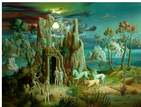
«Le Jugement de Pâris» (Peter Proksch)