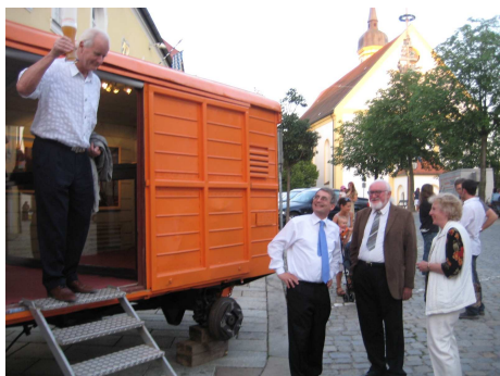
Le Wagon de Dali à Viechtach, été 2010

Le 6 e salon de l'Art fantastique européen – SAFE 2011 – sera l'occasion de réunir une fois de plus dans les halles néo-byzantines des Thermes du Mont-Dore 13 peintres talentueux issus de toute l'Europe. Compte tenu de la situation géographique particulière de l'accueillante station d'hiver du Puy-de-Dôme, le salon de 2011 sera consacré au thème des « Volcans ». Le surréaliste de Brème Siegfried Zadernack sera l'invité d'honneur et président du Jury du traditionnel trophée « Apocalypse Dore ».